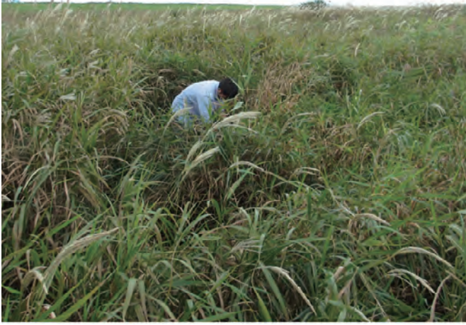
Photo1. M. sacchariflorus collected in Teshio, Rumoi region, Hokkaido (Col.No.72, Teshiogawa kakou).

写真1. 天塩町(北海道留萌地方)で収集したオギ(収集番号 72, 天塩川河口)