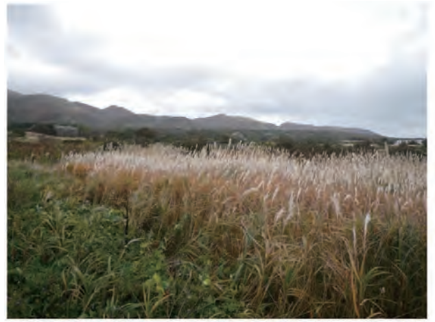
Photo 4. M. sacchariflorus collected in Matsumae, Oshima region, Hokkaido (Col. No.99, Matsumae).