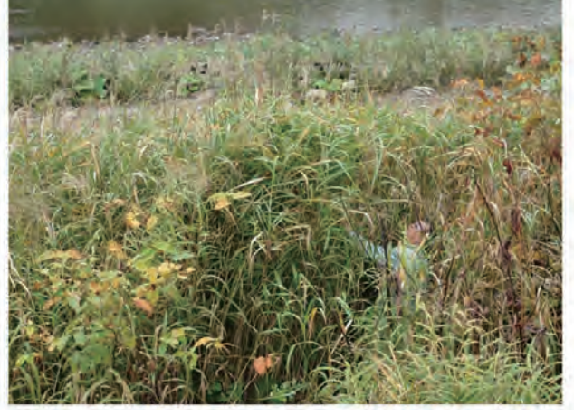
Photo 2. M. sacchariflorus collected in Biei, Kamikawa region, Hokkaido (Col. No.86, Biei).

写真1. 天塩町(北海道留萌地方)で収集したオギ(収集番号 72, 天塩川河口)