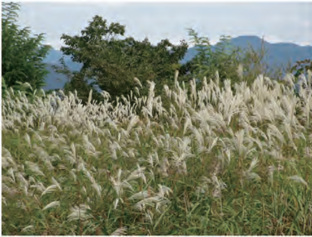
Photo 3. M. sacchariflorus collected in Shin-Hidaka, Hidaka region, Hokkaido (Col. No.78, Shizunai).