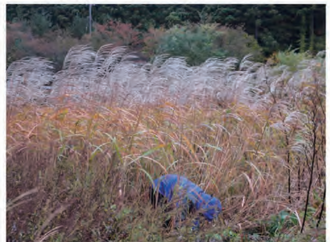
Photo 6. M. sacchariflorus collected in Sotogahama, Tsugaru, Aomori (Col.No.T13, Minmaya).