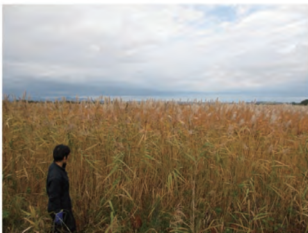
Photo 5. M. sacchariflorus collected in Misawa, Shimokita, Aomori (Col.No.T3, Hotokenuma).