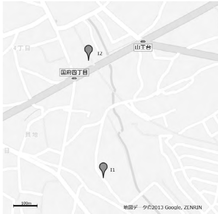
Fig. 4. A map of sites in Ishioka City, Ibaraki Prefecture.