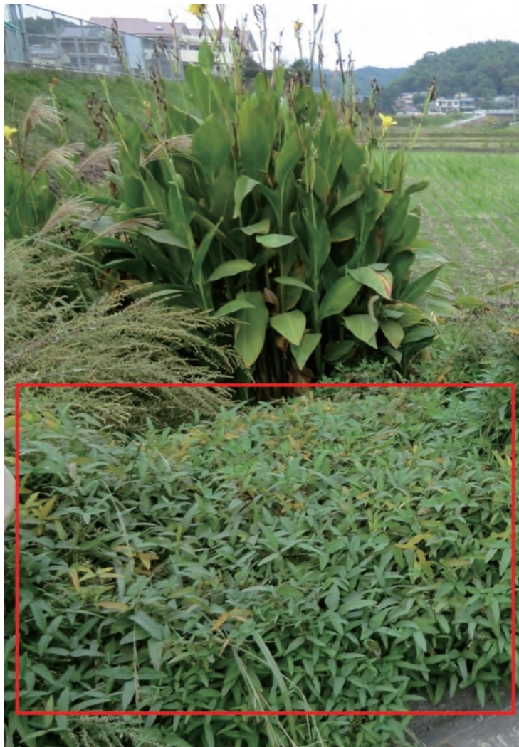
Photo 1. Wild soybean population in Southern Kyushu. 九州南部のツルマメ群落（収集地点：8, 鹿児島県鹿児島市川上町）