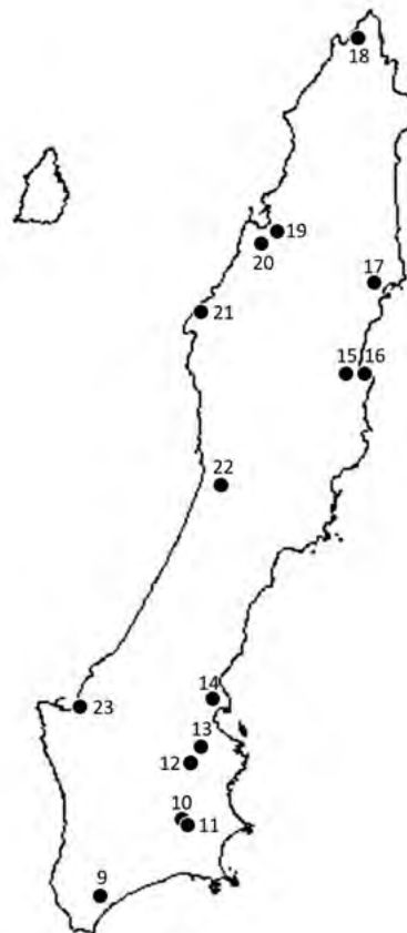
Fig. 2 Collecting sites of wild soybean in Tanegashima Island. 種子島におけるツルマメ収集地点 (数値地図 25000 (行政界・海岸線) 全国 平成 12 年版 国土地理院発行より海岸線を複製し作図)