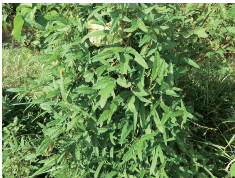
Photo 2. Wild soybean population on Tanegashima Island. 種子島のツルマメ群落（収集地点：9, 鹿児島県熊毛郡南種子町西之）