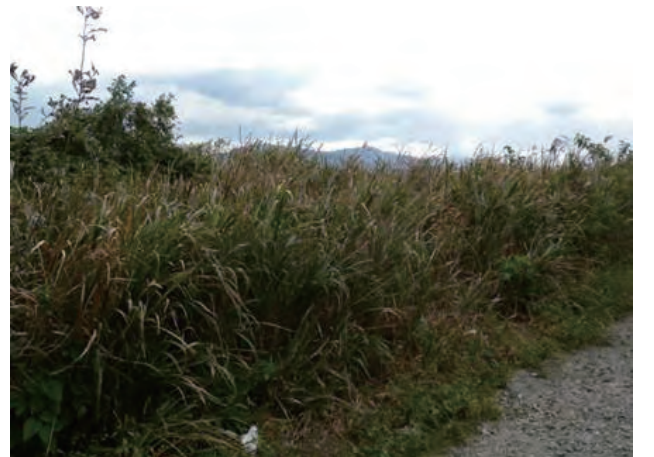
Photo 4. Individual collected in Houfu. (Col. No. 16) 四万十市で採集されたオギ (採集番号 16)