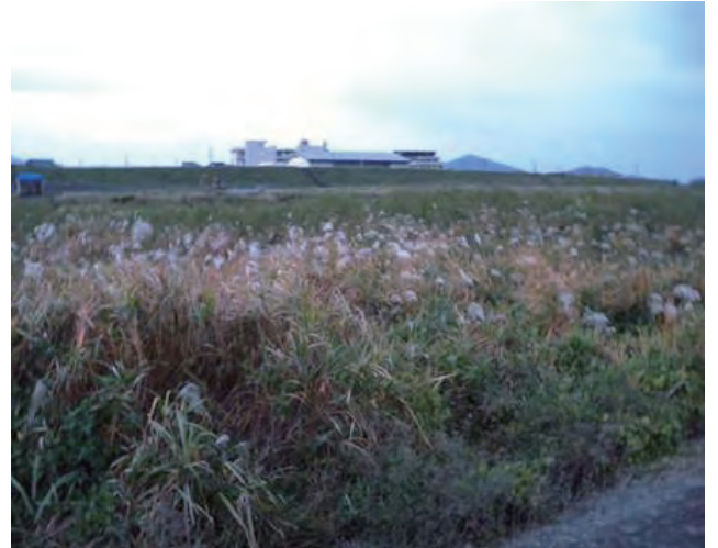
Photo 2. Individual collected in Houfu (Col. No. 12) 防府市で採種されたオギ (採集番号 12)