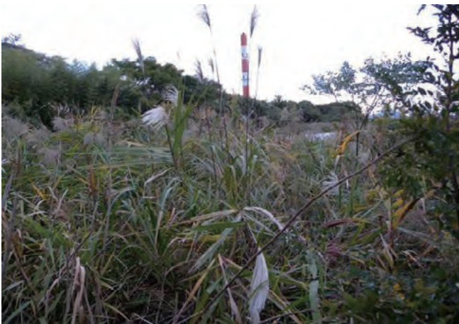
Photo 3. Individual collected in Houfu. (Col. No. 15) 香東川で採集されたオギ (採集番号 15)