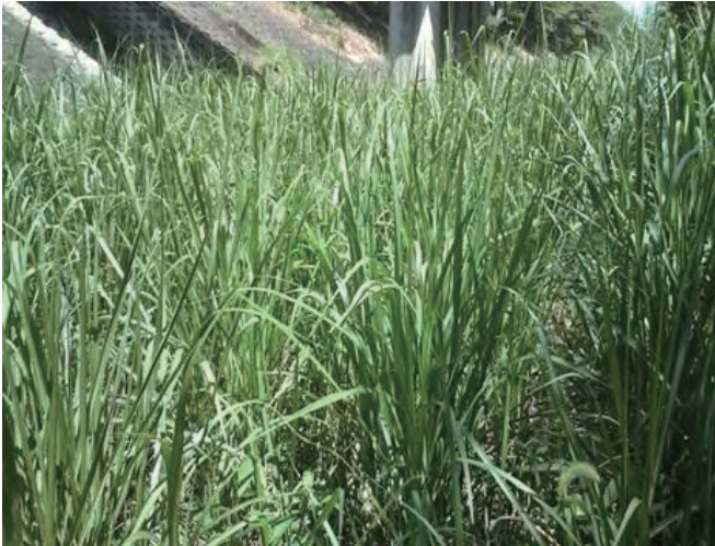
Photo 1. Individual collected in Kashihara (Col. No. 6) 橿原市で採集されたオギ (採集番号 6)