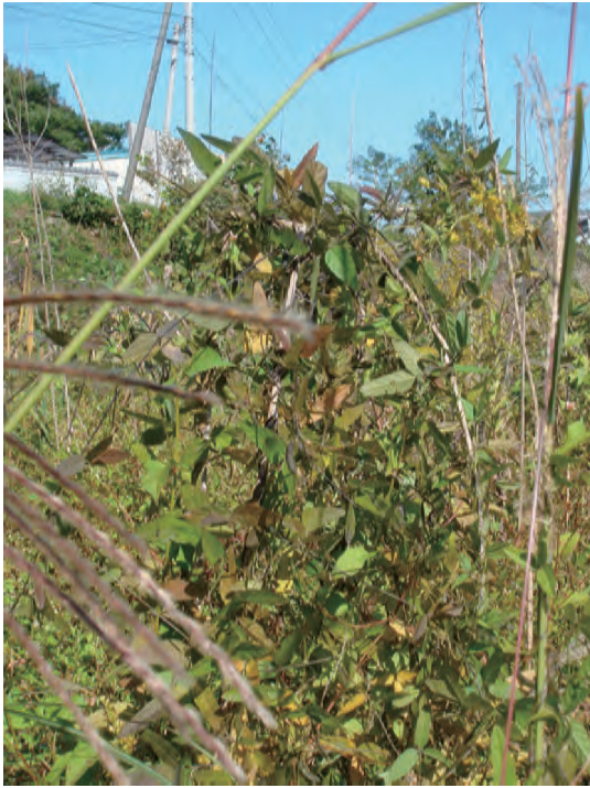
Photo 1. A wild soybean collected at Kunita river in Kagawa prefecture.

香川県杵田川で収集したツルマメ (COL/ 香川 /2010/ 近中四農研 /058 ツルマメ)