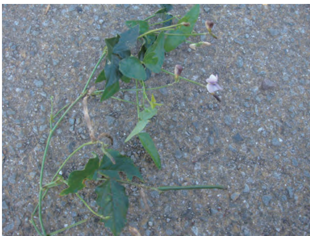
Photo 3. An escaped natural population of cowpea collected at Monobe river in Kochi prefecture.

高知県安芸川で収集したアズキのエスケープ (COL/ 高知 /2010/ 近中四農研 /001 アズキ?)