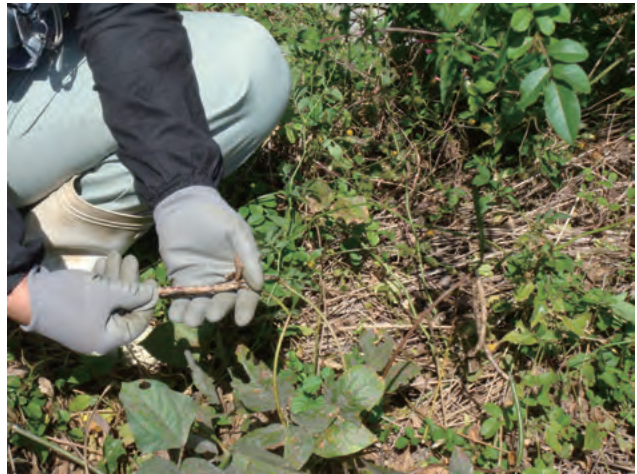
Photo 2. An escaped natural population of azuki bean collected at Aki river in Kochi prefecture.

香川県杵田川で収集したツルマメ (COL/ 香川 /2010/ 近中四農研 /058 ツルマメ)