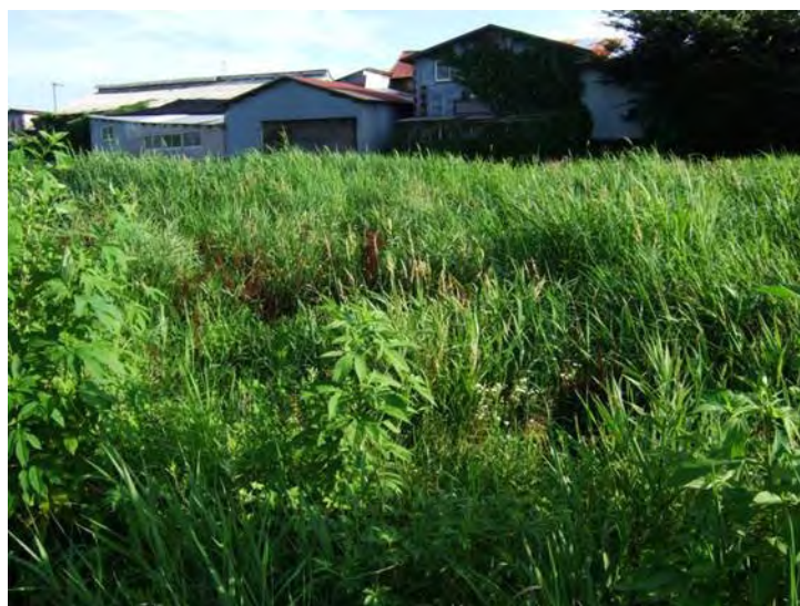
Photo 3. 男鹿市の耕作放棄地 クサヨシ群落