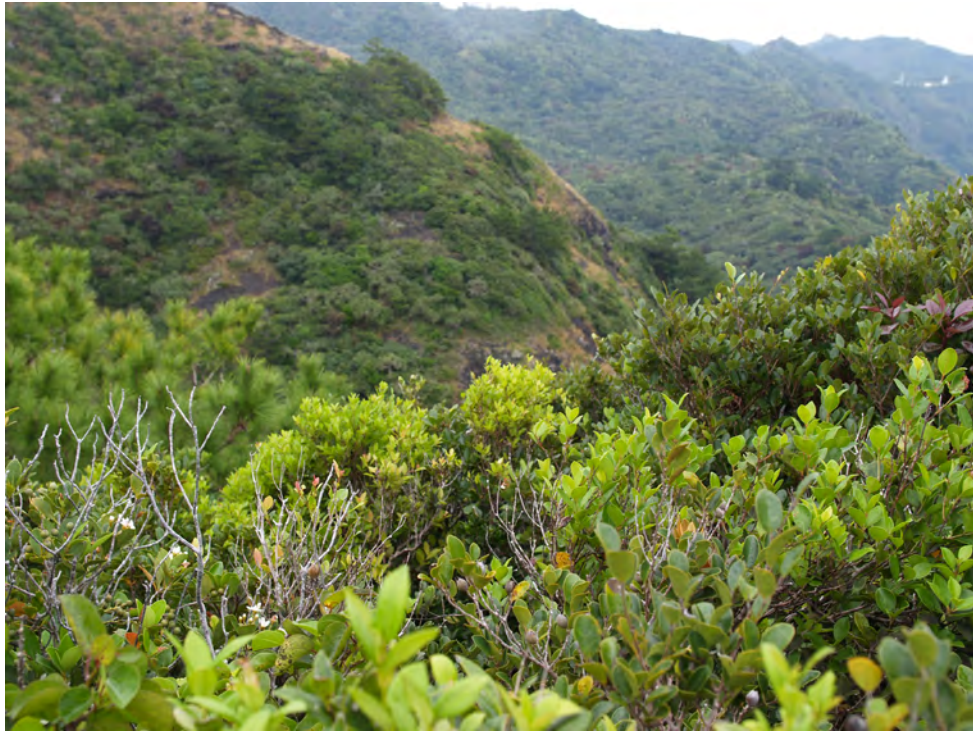
Photo 1. 父島の乾性低木林 A view of subtropical dry scrub of Chichijima Island