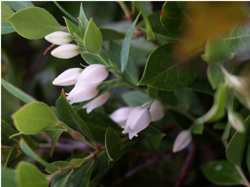
Photo 9. ムニンシャシャンボの花 Flowers of a Muninshashanbo plant