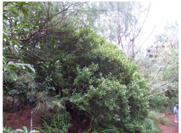
Photo 5. ムニンシャシャンボの自生状況 (宮ノ浜) A habitat of Muninshashanbo (Miyano-hama)