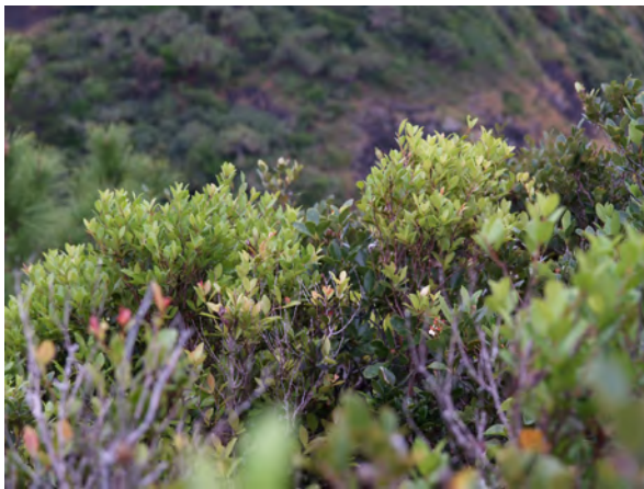
Photo 2. ムニンシャシャンボの状況 (旭山) A habitat of Muninshashanbo(Asahi-yama)