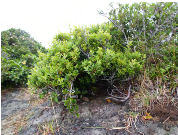
Photo 4. ムニンシャシャンボの自生状況 (中央山) A habitat of Muninshashanbo(Chuo-zan)