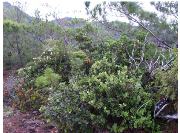
Photo 3. ムニンシャシャンボの自生状況 (初寝浦) A habitat of Muninshashanbo(Hatsuneura)