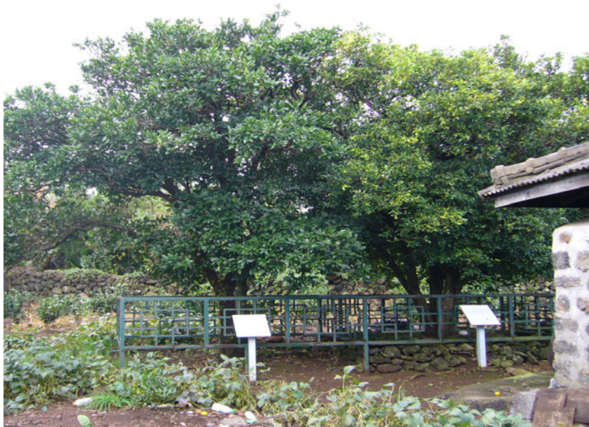
Photo 3. Jeju 市によるカンキツ古木の保護状況