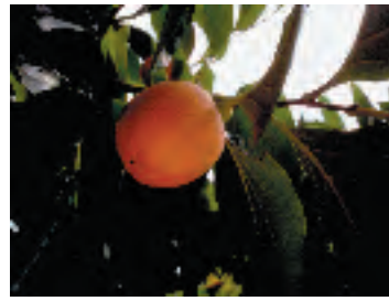
Photo 9. 尚州 Dungsì.