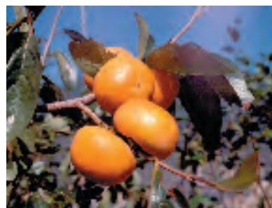
Photo 13. 早紅柿.