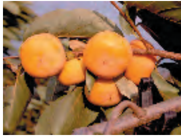
Photo 8. 清道柿.