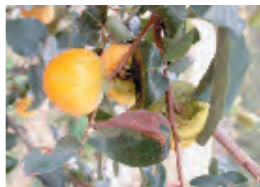
Photo 7. 高種柿.