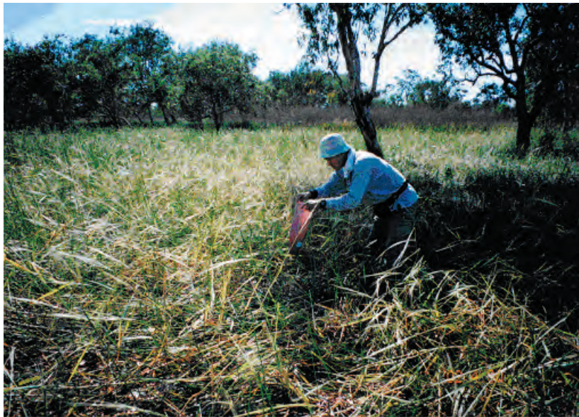
写真2. O. meridionalis 収集 (No.7) Mataranka 近郊