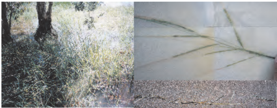
写真4. O. rufipogon (No.24) ダーウィン近郊 Fogg Dam 内