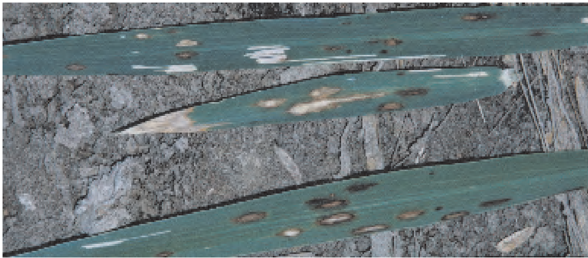
写真3. O. meridionalis の病斑 (No.18)