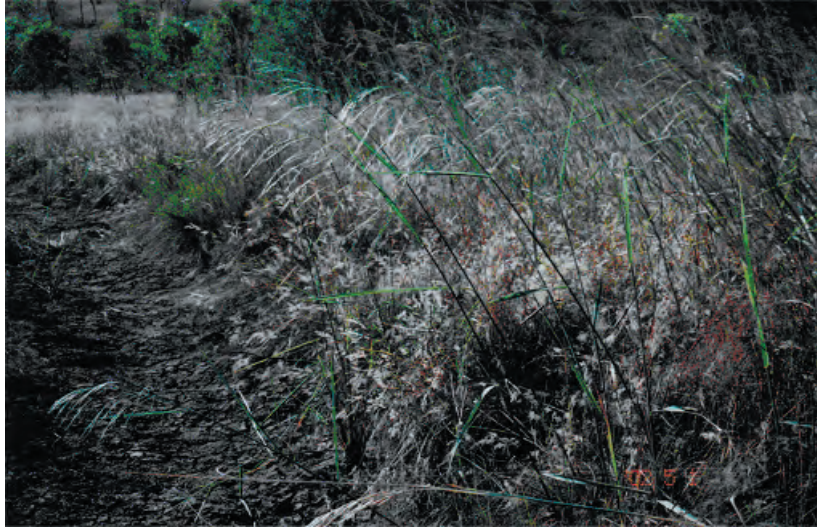
写真1. O. australiensis (No.8) Kununurra 近郊