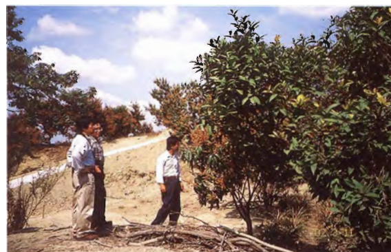
写真6. マンゴー新品種「金興」の原木 マンゴー偶発実生から選抜された新品種「金興」の原木。台南県南化郷のマンゴー農園にて。