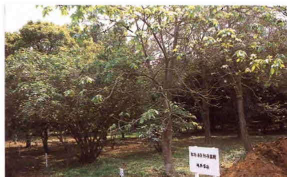
写真4. 嘉義農業試験分所遺伝資源保存園 多くの熱帯・亜熱帯果樹を保存している。