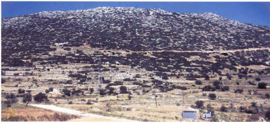
ペロポネソスの山岳