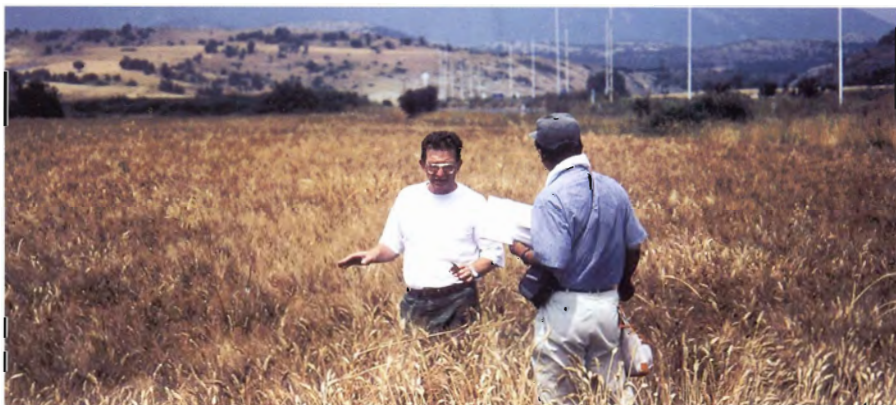
マケドニアでの収集