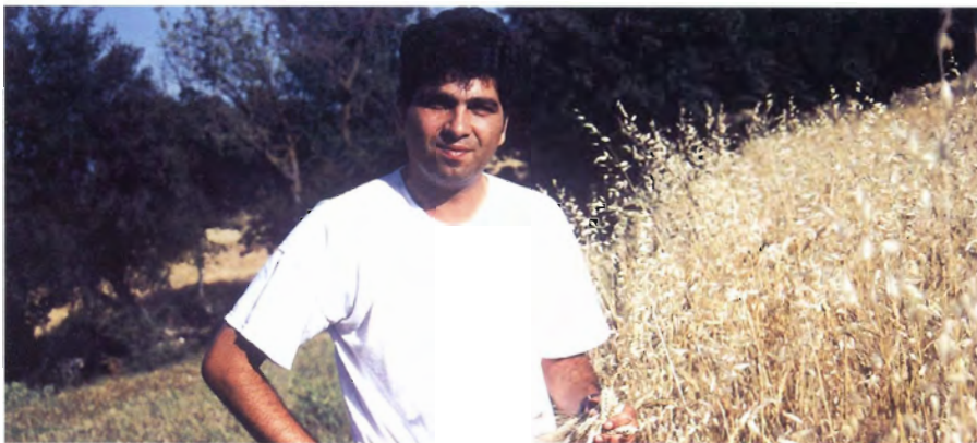
ペロポネソスでの収集