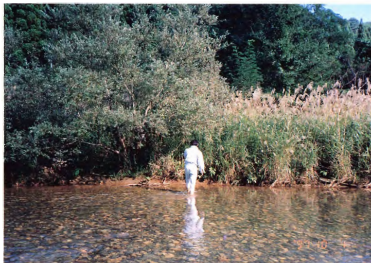
2. 最上川源流付近でのツルマメ探索