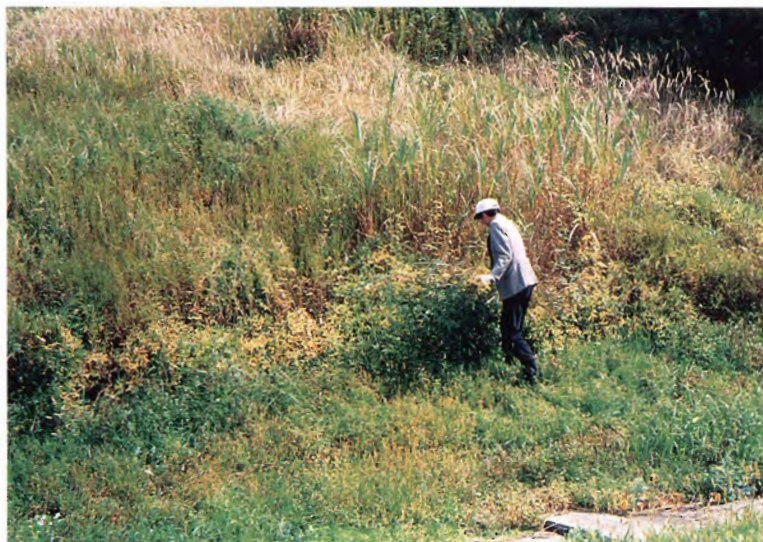
1. 最上川上流域で群生している黄葉期頃のツルマメ収集