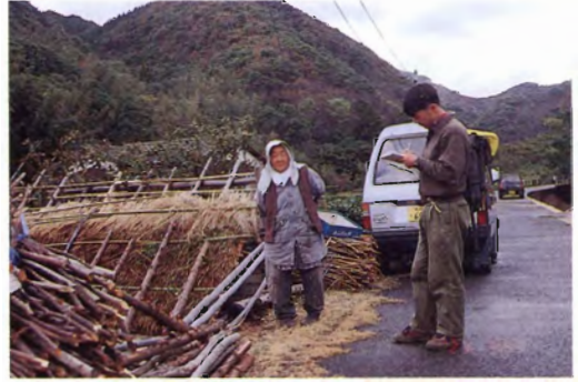
ソバは島内のいたる所で収穫されていた