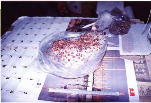
豆餅 (別名 “元寇の餅”)

ゆでたツルアズキに塩をふって餅の表面に張り付ける。1月の元寇の祭りや家屋の新築・屋根葺きの祝いに作る。