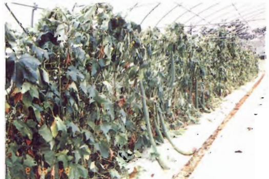
沖縄本島, 果長が2 mにもなるという在来のヘチマ