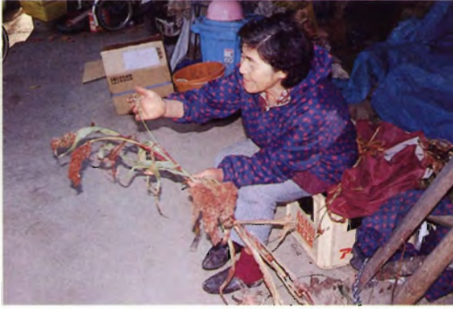
美津島町加市志において収集したモロコシ (呼称: キビ)