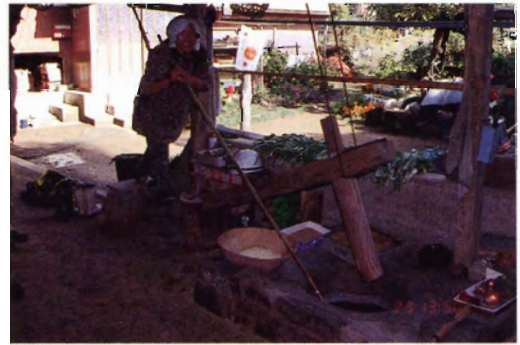
唐臼 (豊玉町仁位 国分氏)

ゆでたツルアズキに塩をふって餅の表面に張り付ける。1月の元寇の祭りや家屋の新築・屋根葺きの祝いに作る。