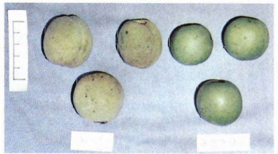
加茂町津川川ダム野生モモの果実 左：毛モモ 右：ネクタリン