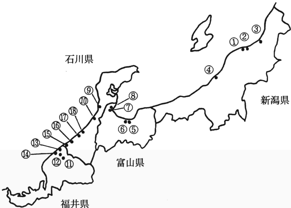
Fig. 1 Collection sites of Leymus and Elymus species in Hokuriku district in 1993 (refer to Table 1)

収集は1993年9月13日から15日の間、新潟県紫雲寺町から福井県金津町までの間18箇所を実施した (Fig. 1)。海岸線沿いに国道345号、8号、415号、305号線を西に移動しながら、砂浜を中心に探索を行い、株の収集を行った。