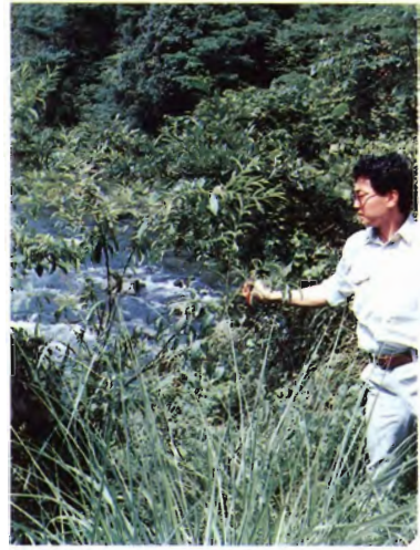
加茂川町宇甘溪の川沿いに生える野生モモ