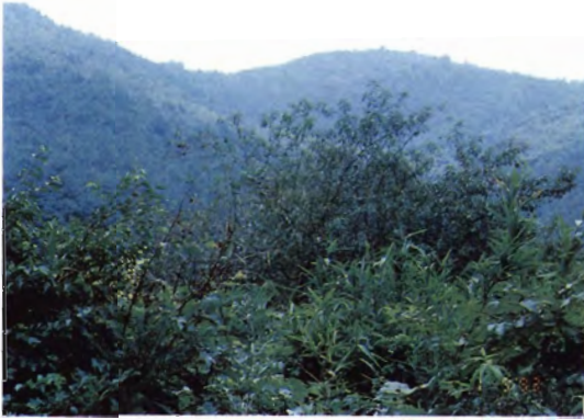
勝北町声ヶ峠スカイライン沿いに自生する 野生モモ