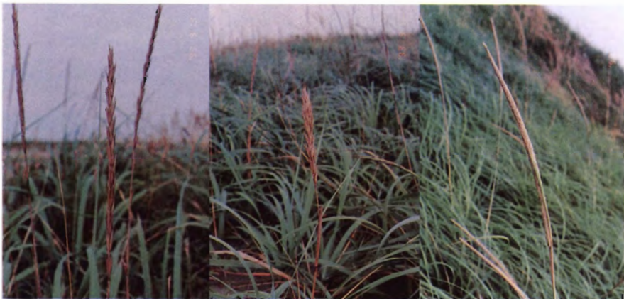
Leymus mollis (Trin.) Pilger (テンキグサ) の穂型 左：典型的なテンキグサの穂型 (AG. 93-18) 右：短稈で穂が太い株の穂型 (AG. 93-19)