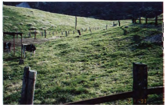
徳島県鳴門市大麻牧場