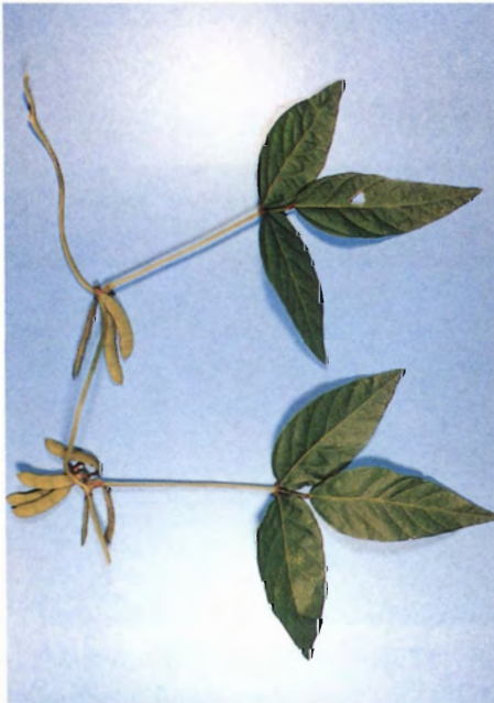
野生大豆の莢と葉