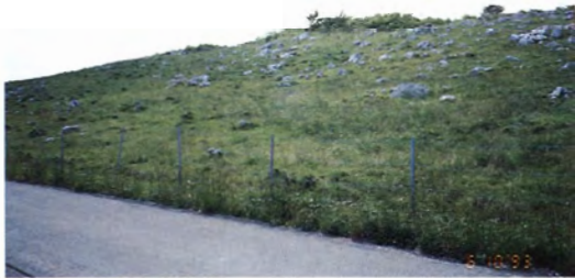
高知県高岡郡梶原町天狗高原 (四国カルスト)