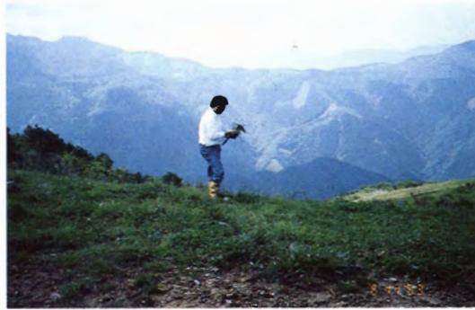
徳島県三好郡西祖谷山村 腕山牧場