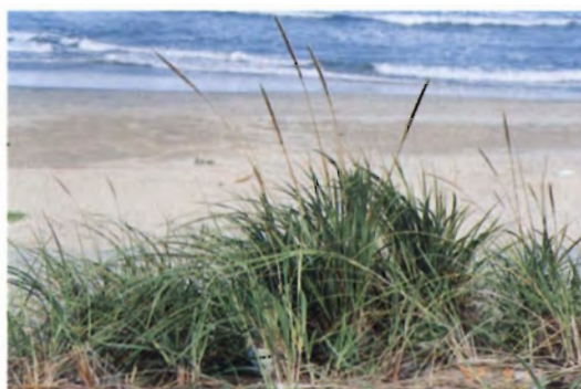
Elymus mollis Trin. (和名：テンキグサ、ハマニンニク)