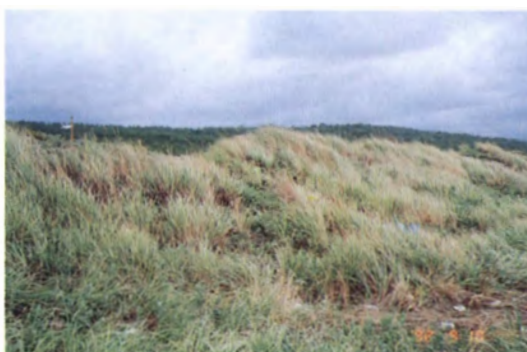
E. mollis の大群落 (鳥取市賀露町西浜 鳥取港西側の海岸)