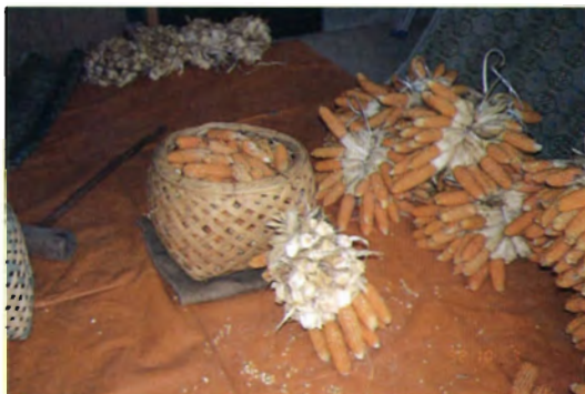
在来トウモロコシ・和田種 (東津野村)