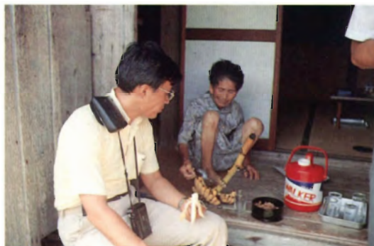
鳩間島における収集風景 在来種バナナ( Musa sapientum )は小振りだが美味