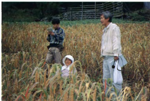
傾斜地に作られているアワ (東祖谷山村)