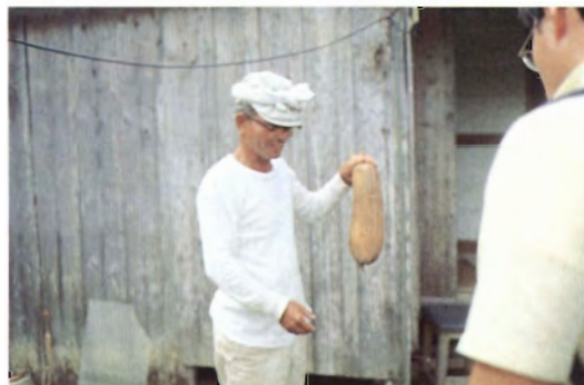
ヘチマ( Luffa cylindrica )の種子用果実