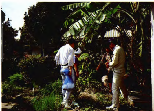
農家裏庭での収集（波照間島）