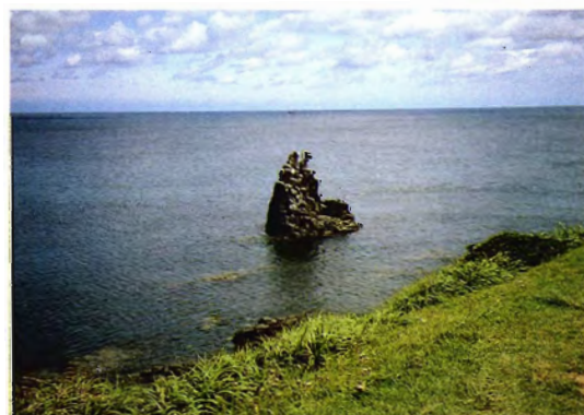
海岸洗の自生地 （長崎県壱岐）