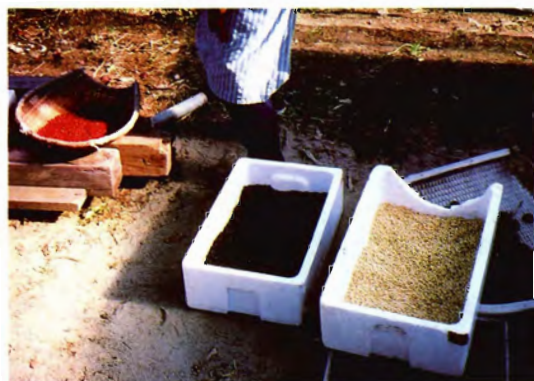
農家庭先での黒アズキと白アズキの収集 （秋田県）