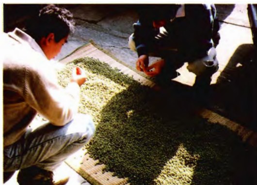
ズンダもちにする青ダイズの収集 （山形県）