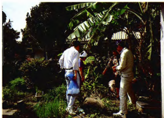
農家裏庭での収集（波照間島）