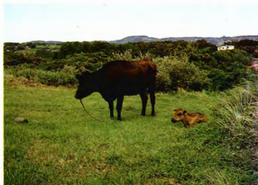
放牧地に自生するシバ属植物 （長崎県壱岐）