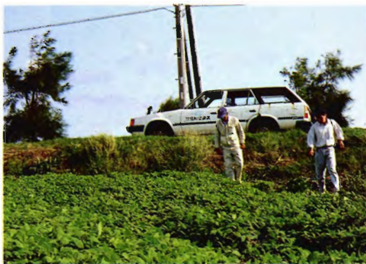
在来ダイズ（ゲダイズ）畑（波照間島）