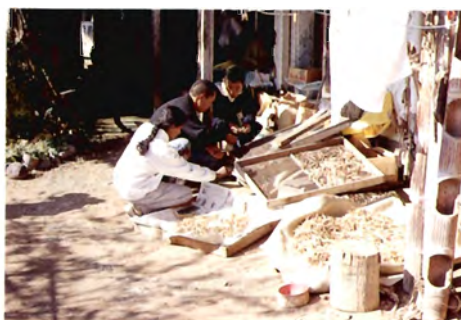
天竜村，農家の庭先にて豆類の収集