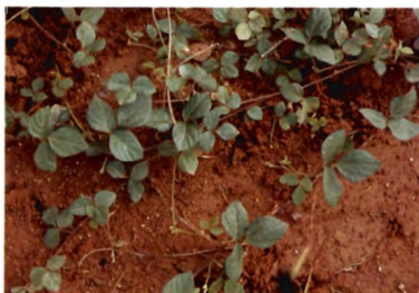
Vigna riukiensis ，中野バス停近くの荒地にて