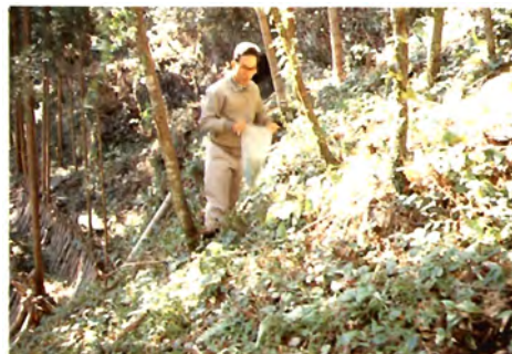
西米良村村所 しいたけ栽培をしている農家の裏山 竹林の中にもヤマチャが点在している。