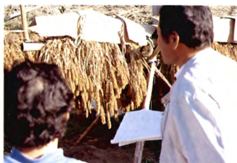
上村にてアワの収集