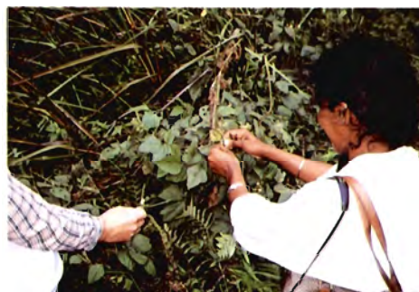
星立近くの道路添いの林縁にて V. reflexopilosa の収集