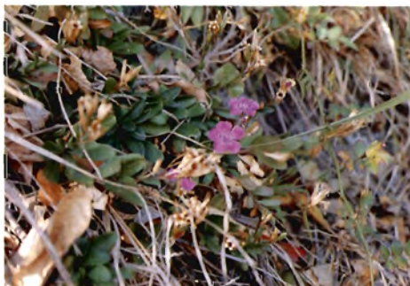
ヒメハマナデシコ ( D. kiusianus ) の自生状況 (鹿児島県川辺郡坊津町地内，沿海部砂礫地)