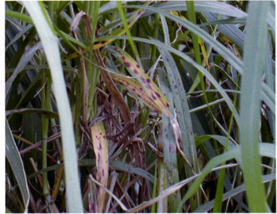
石垣市で観察したチカラシバ属植物の病徴 (月星)