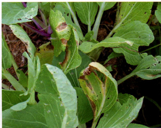
笠利町（奄美大島）で観察したチンゲンサイの病徴 (堀田)