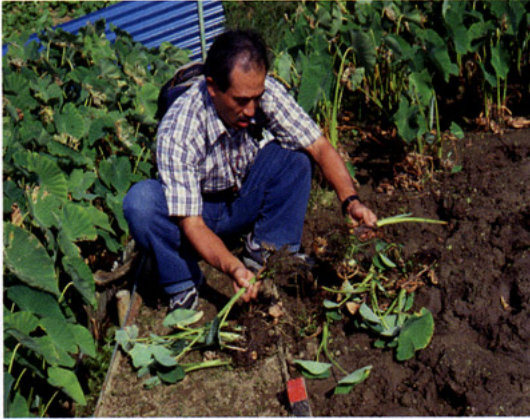
宜野湾市におけるタイモ腐敗塊茎の調査・収集 (佐藤)