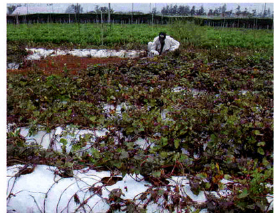
沖縄本島における植物病原細菌の探索・収集 (堀田)