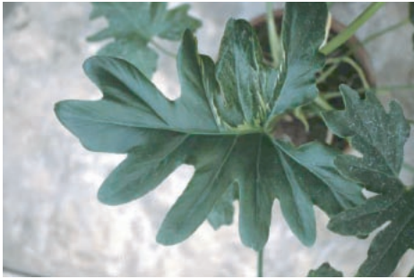
写真4 KoMV (MAFF 104056) を接種したヒトデカズラの上位葉に現れたモザイク病徴