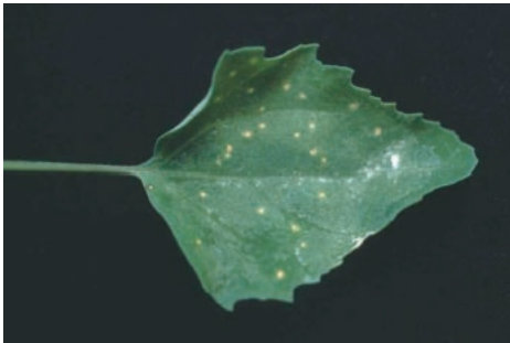
写真5 KoMV (MAFF 104056) を接種した Chenopodium quinoa の葉に生じた局部病斑