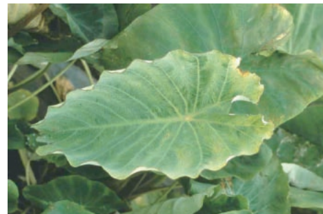
写真1 サトイモのモザイク病徴

我が国で栽培されるサトイモ及びコンニャクには、DsMV 及び KoMV の感染によるモザイク病 (写真1, 2) が広く発生しており、親芋から子芋へ高率に種球伝染することから、その発生率は高い。またモモアカアブラムシ及びワタアブラムシによる媒介が確認されている。なお、サトイモ及びコンニャクのモザイク病の病原として、ほかにキュウリモザイクウイルス (径約 28nm の小球形粒子) が発生している。