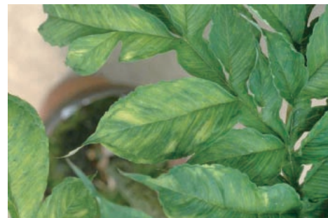
写真2 コンニャクモザイク病徴