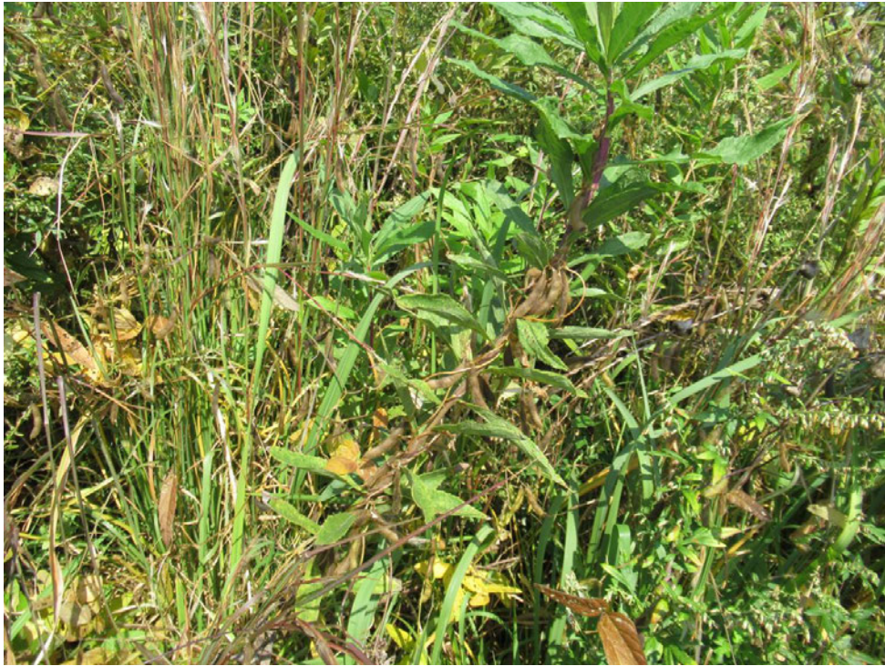
Photo 1. A wild soybean accession (JP269351) collected from along the Yoshii River.

写真 1. 吉井川流域で収集したツルマメ (JP269351: COL/ 岡山 /2018/ 西日本農研 /GS12).