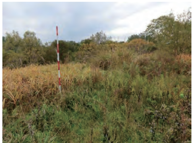
Photo 4. 岩木川周辺の自生地の様子 (収集番号 17) A habitat of Miscanthus sacchariflorus Bentham in the region surrounding the Iwaki River (Col. No.17).