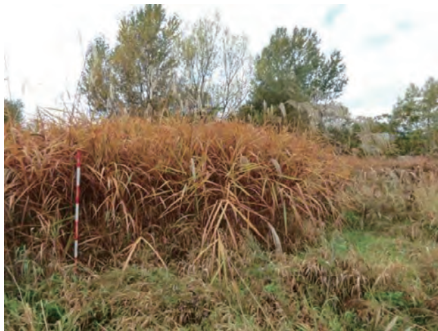
Photo 3. 岩木川周辺の自生地の様子 (収集番号 16) A habitat of Miscanthus sacchariflorus Bentham in the region surrounding the Iwaki River (Col. No.16).