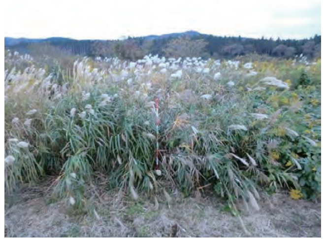
Photo 2. 雄物川周辺の自生地の様子 (収集番号 9) A habitat of Miscanthus sacchariflorus Bentham in the region surrounding the Omono River (Col. No.9).