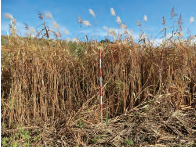
Photo 1. 雄物川周辺の自生地の様子 (収集番号 5) A habitat of Miscanthus sacchariflorus Bentham in the region surrounding the Omono River (Col. No.5).