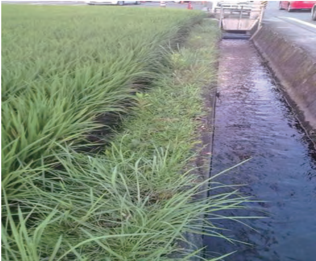
Photo 1. Individual collected in Kusuminaka (Col. No.3) 楠見中で採集された自生株（採集番号 3）