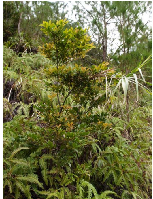
Photo 5. 奄美大島南部のギーマ自生状況 A habitat of Giima in the southern part of the Amami-Oshima Island.