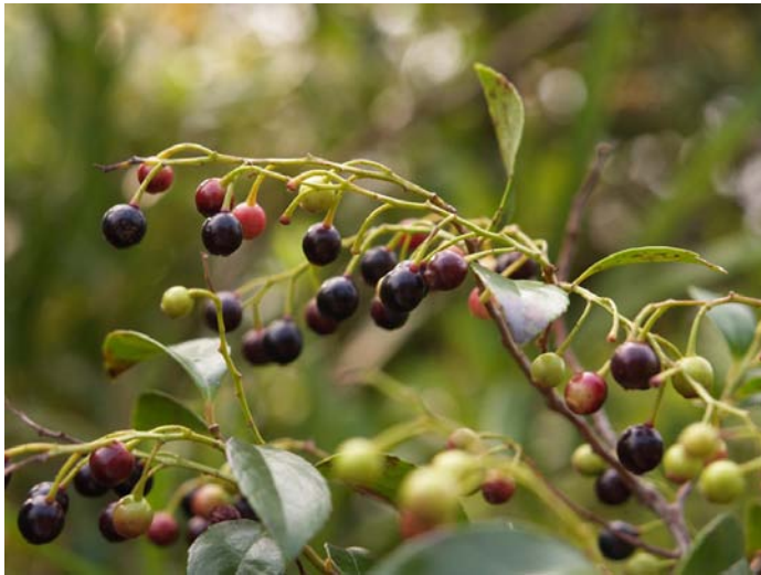
Photo 4. 奄美大島北部のギーマの果実および葉 Fruit and leaves of Giima plants in the northern part of the Amami-Oshima Island.