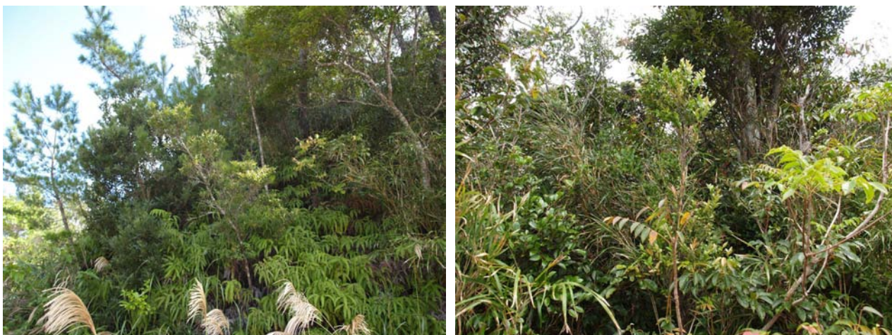
Photo 1. 沖縄本島北部のギーマ自生状況

Some habitats of Giima in the northern part of the Okinawa Main Island.