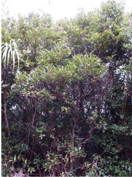
Photo 3. 奄美大島北部のギーマ自生状況 A habitat of Giima in the northern part of the Amami-Oshima Island.