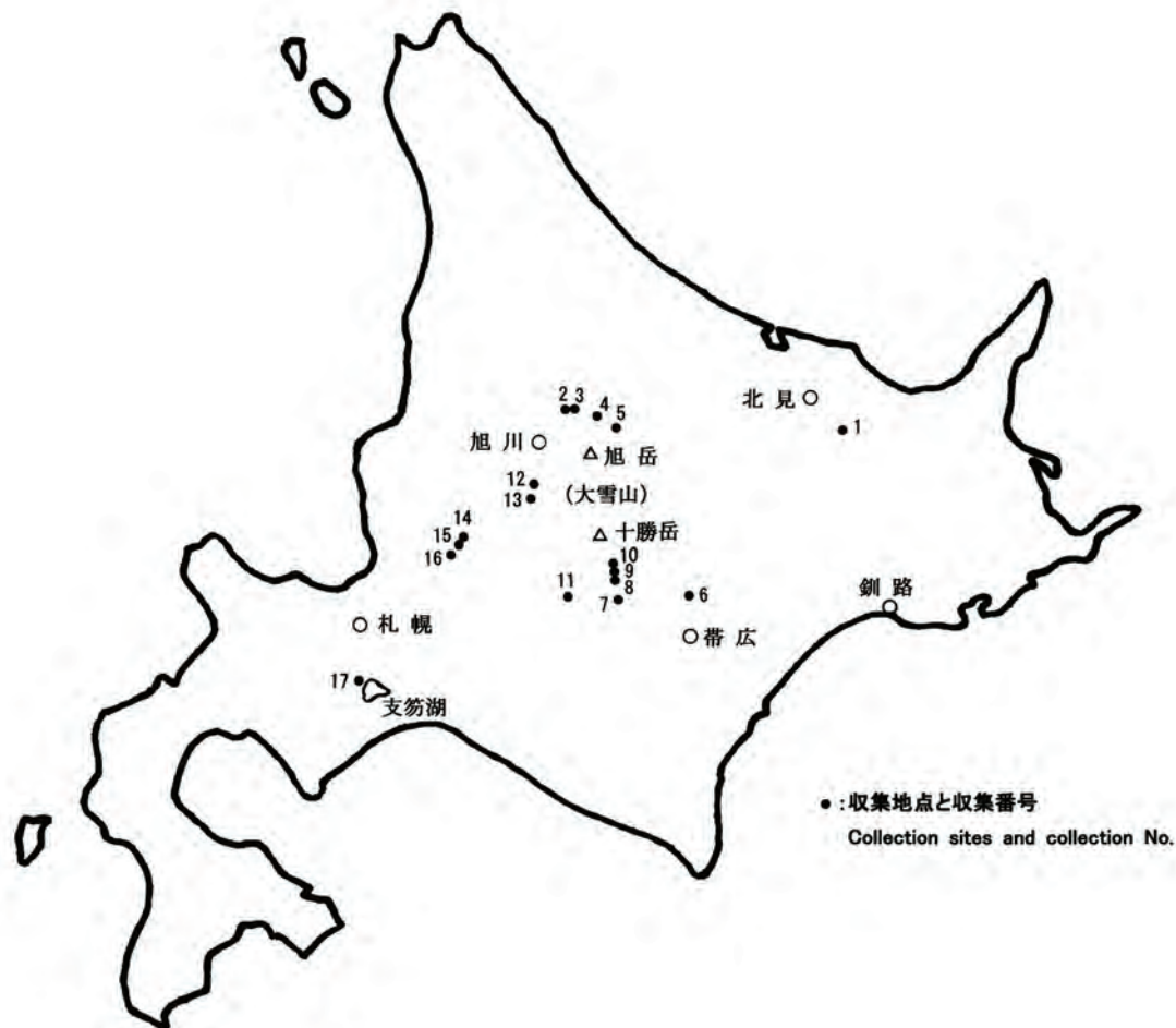
Fig.1. 北海道道央地域における桑の収集地点 Collection sites of Morus bombycis K. in the central area of Hokkaido

3日目はさらに高標高地からの収集を目指して、美瑛町から道道986号線を大雪山方向に遡り、十勝岳近くから道道291号線を上富良野へ下るルートで、大雪山東側山麓における探索を新たに行った。この付近はクワの分布密度が比較的高く、標高400mあたりまでは多くのクワが自生していた。道道986号線近くの美瑛川沿い及び道道291号線脇で、それぞれの最も標高の高い地点で発見されたクワを収集したが（収集番号12～13, Photo 6）、いずれも標高500mを越える地点からであり、特に美瑛川沿いの個体は今回の最高標高地点から採取したものである。その後は事前調査と同じルートをたどり、三笠市で予定していた3個体の枝を採取した（収集番号14～16）。