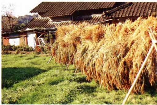
収穫したアワを乾燥しているところ

アキアズキ アキダイズ クロマメ 鹿児島県で収集したインゲンマメ, アズキ, ササゲの種子変異。上段左からNC 950011, NC 950018, NC 950005, 下段左からNC 950042, NC 950025, NC 950025