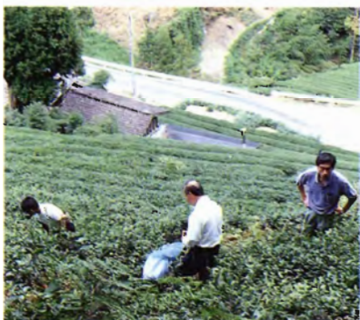
高知県高岡郡仁淀村 西森氏茶園 愛媛県境に近い仁淀村の急斜面で収集