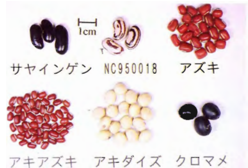
サヤインゲン NC950018 アズキ

アズキ クロアズキ ダイズアズキ 鹿児島県で収集した Vigna (ササゲ)属マメ類の種子変異。上段左からNC 950002, NC 950013, NC 950028, 下段左からNC 950014, NC 950020, NC 950051