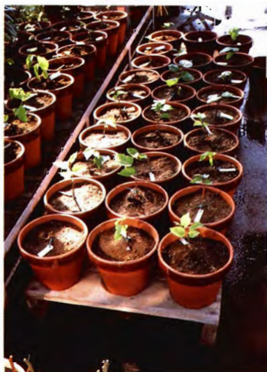
収集した野生桑の接木苗