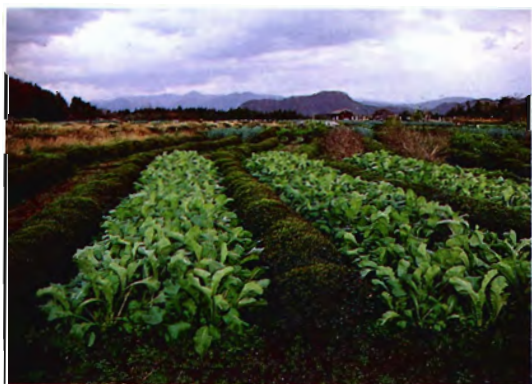
新潟県村上市の茶園