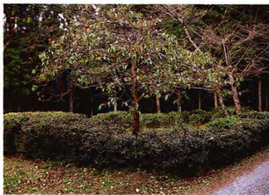
岩手県陸前高田市の茶樹