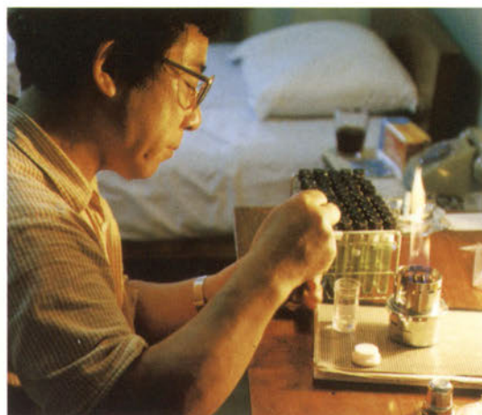
採取した根をホテルへ持ち帰り窒素固定菌を分離する（タイ国）