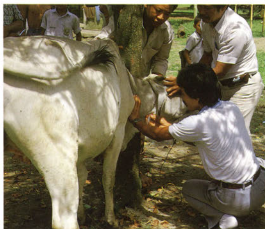
インドネシア国の牛や水牛の寄生住血原虫タイレリアを分離するために現地の牛から採血する