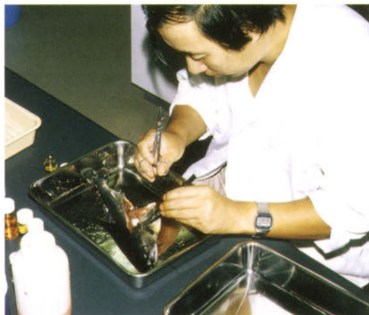
病魚から病原体を分離するとともに、病変組織を摘出し固定する