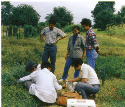
タイ国の研究者らの協力を得て、現地のマメ科やイネ科作物の根から窒素固定菌を分離する